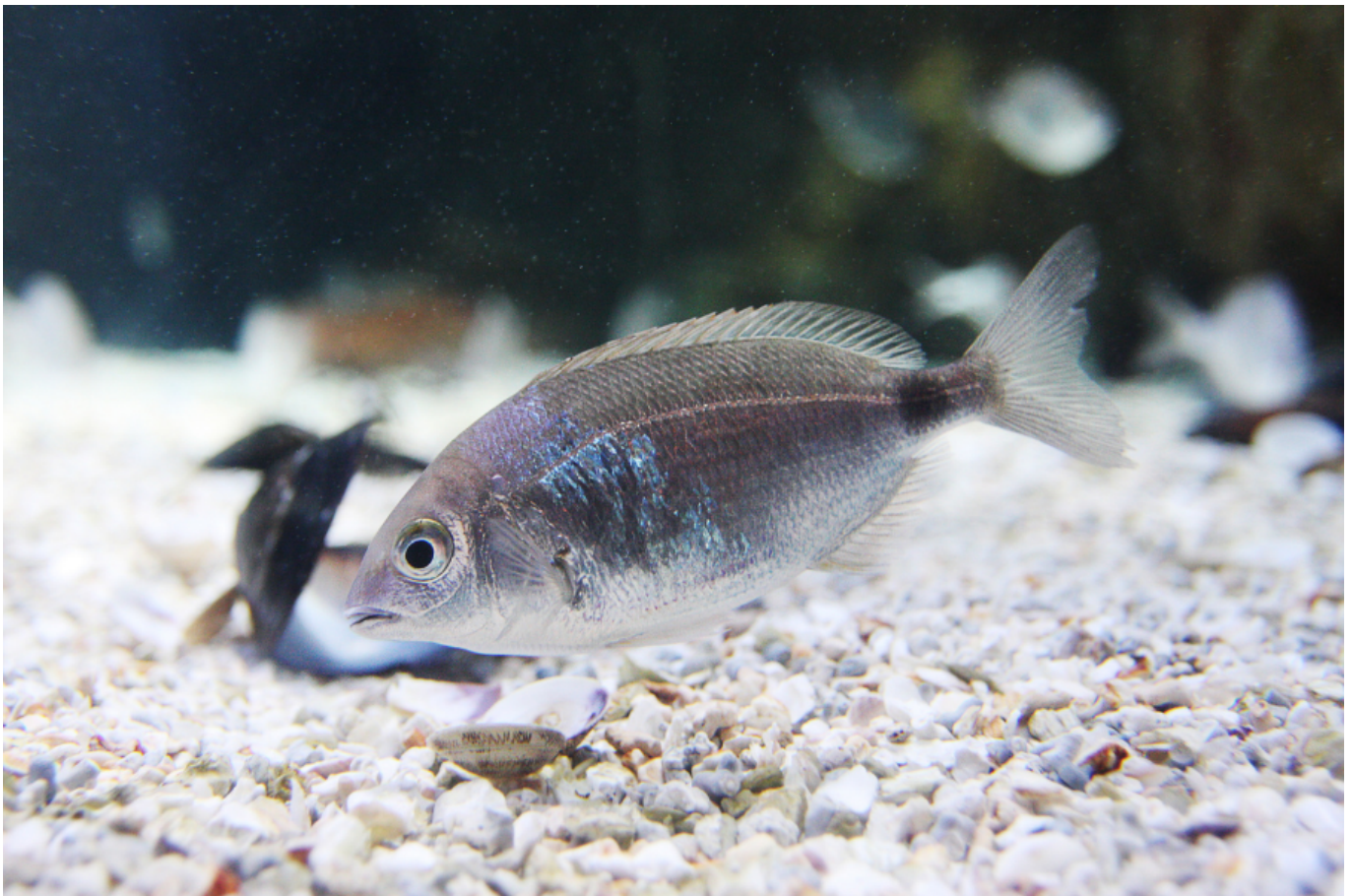
Occhiata di taglia piccola.

Riguardo al rischio specie, l'IUCN (Unione Mondiale per la Conservazione della Natura) dichiara che la specie non è soggetta a rischi imminenti, sia per la sua presunta distribuzione, sia perché non vi sarebbero evidenze di declino o minacce specifiche ( guida all'acquisto dell'Occhiata ).