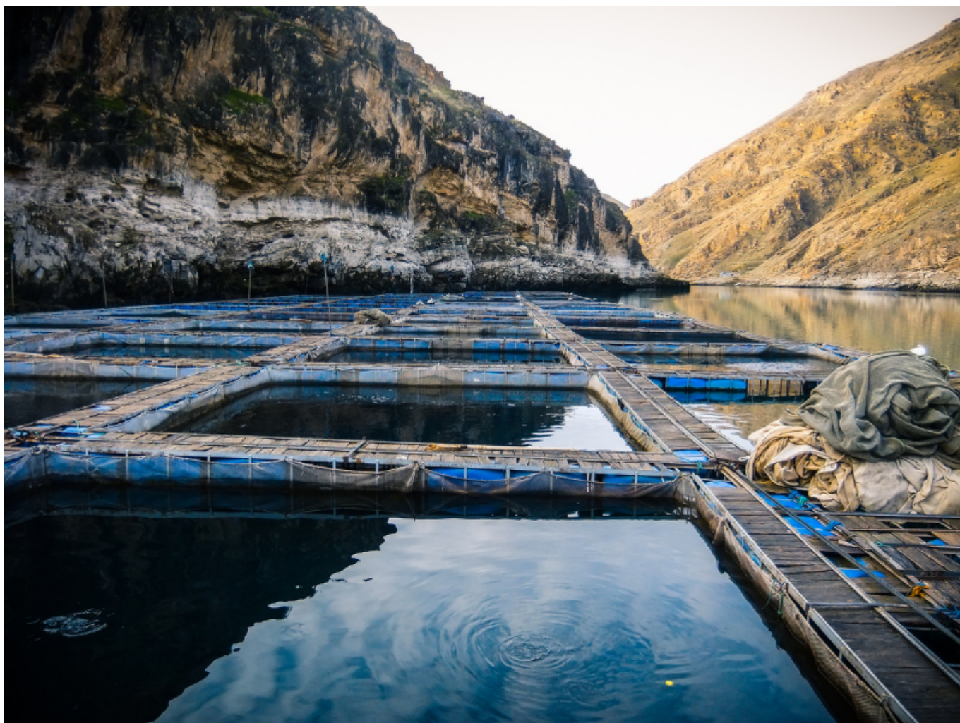
Vasche di piscicoltura in montagna off-shore.