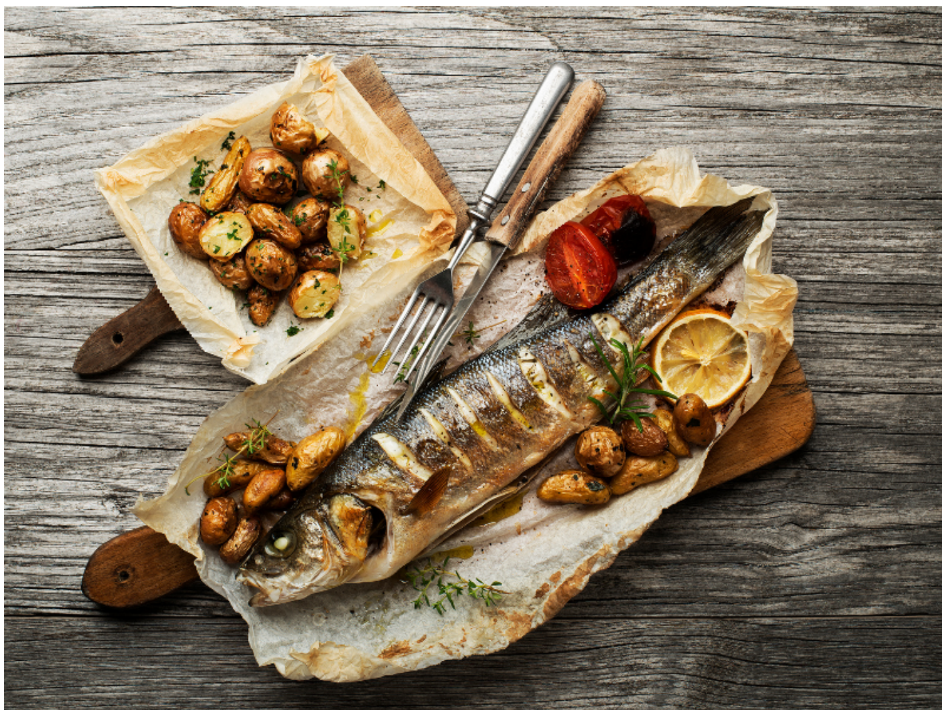
Trota alla griglia con patate e limone.