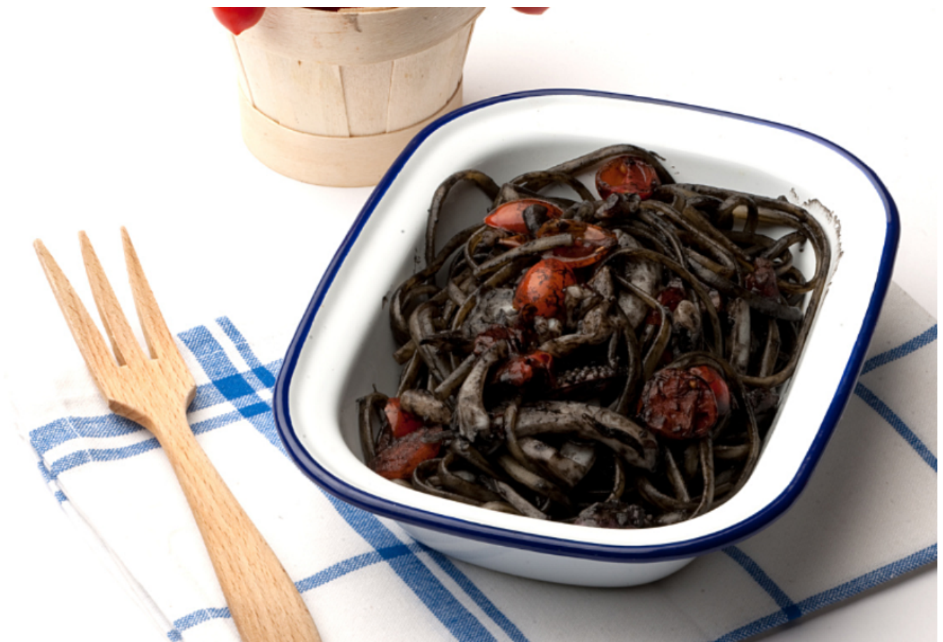
Pasta al nero di Seppia

Se vuoi assaggiare un piatto di pesce a base di Seppia dal ricettario Hello Fish!, prova la più classica e intramontabile delle ricette a base di questo mollusco: