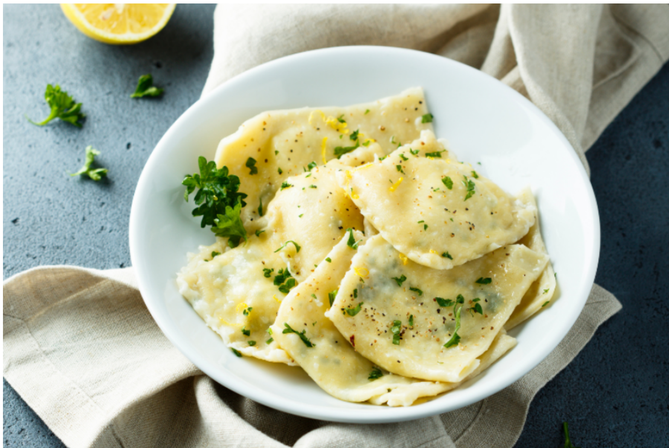
Ravioli di Razza.

questa preparazione che vede questo pesce racchiuso nei lembi di due ravioli: