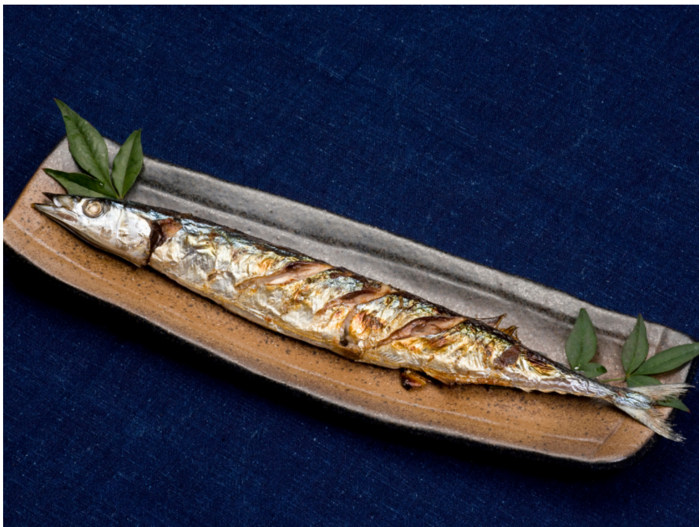
Luccio di Mare arrosto.